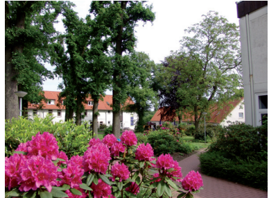
Ev. Heimvolkshochschule, Loccum

Nach der Teilnahme an beiden Blöcken der Fortbildung wird das Zertifikat „Engagementlotse für Ehrenamtliche in Niedersachsen“ vergeben.